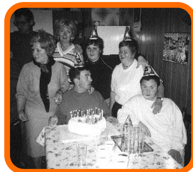
Rođendanska proslava klijenta projekta.

Osnivanje projekta Inkluzija omogućeno je financiranjem od strane Ministarstva rada i socijalne skrbi, te donacijom finskog veleposlanstva i drugih stranih fondacija. □