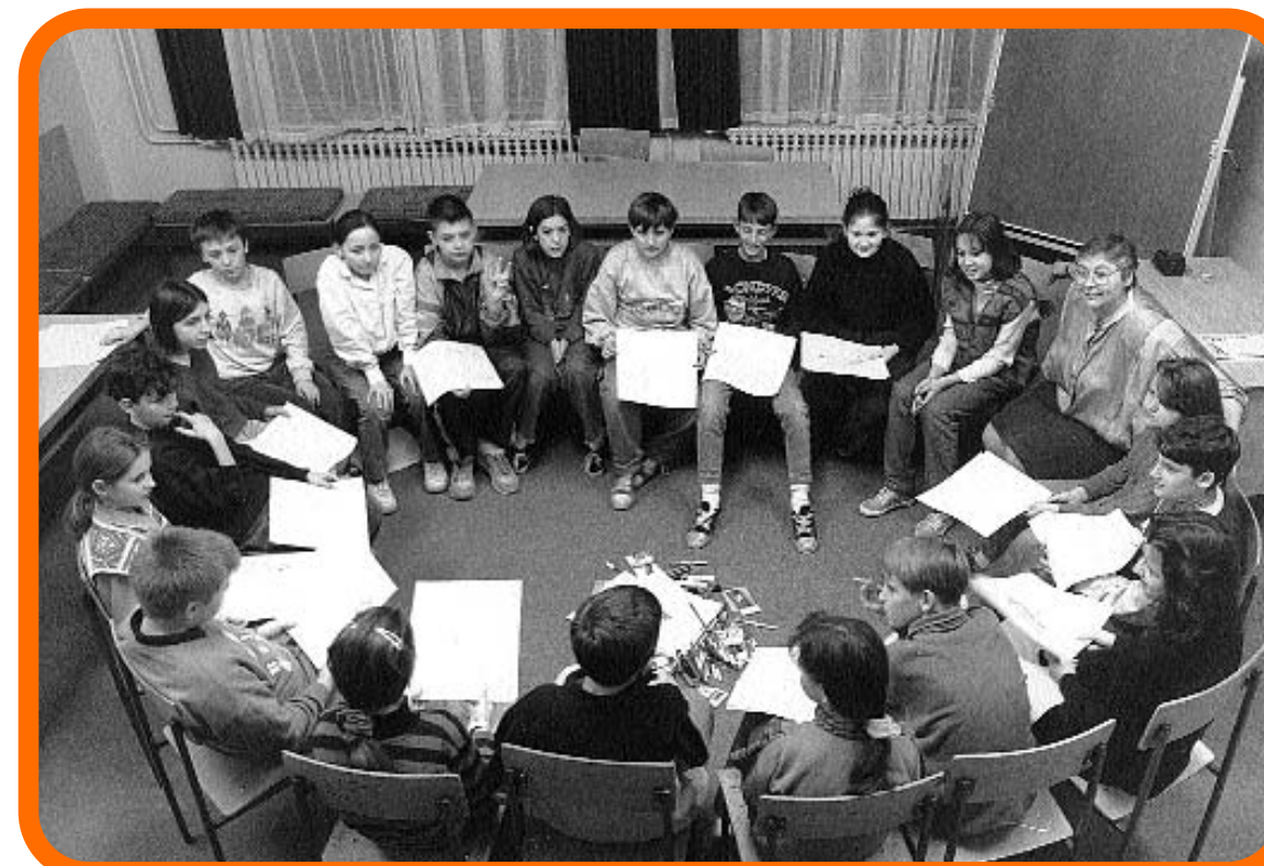
Radionica s djecom 1995. godine.

To je smisao našeg pogleda na obrazovanje kao na proces stvaranja čovjeka dostojnog imena koje nosi, to je smisao obrazovanja čovjeka za mir. Naš Program nastoji ostvarivati taj cilj radom s učiteljima kako bi oni oslobađali i ohrabivali djecu, a djeca nadahnjivala svoje roditelje, prijatelje i da tako širimo mir na našem Planetu. Počeli smo s mijenom u svijesti i srcu, s našim "dvorištem", od našeg komadića neba. □