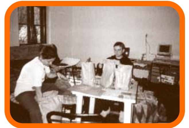
Pakovanje tijesta od integralnog brašna u oslikane vrećice s motivom proljeća.

Ekološko je društvo Zeleni Osijek bilo voditelj kampanje o ekološkoj poljoprivredi u sklopu Akcijske koalicije. Projekt je započeo krajem prošle godine, kada su izrađeni promotivni letci i plakati. Osnovna je svrha kampanje u to vrijeme bilo donošenje zakona o ekološkoj poljoprivredi. Zbog toga smo na poledini letka izradili dopisnicu kako bismo motivirali građane da iskoriste mogućnost sudjelovanja u donošenju odluka o zaštiti okoliša ostvarene potpisivanjem Aarhuske konvencije u Danskoj 1998. Međutim, kampanja je bila