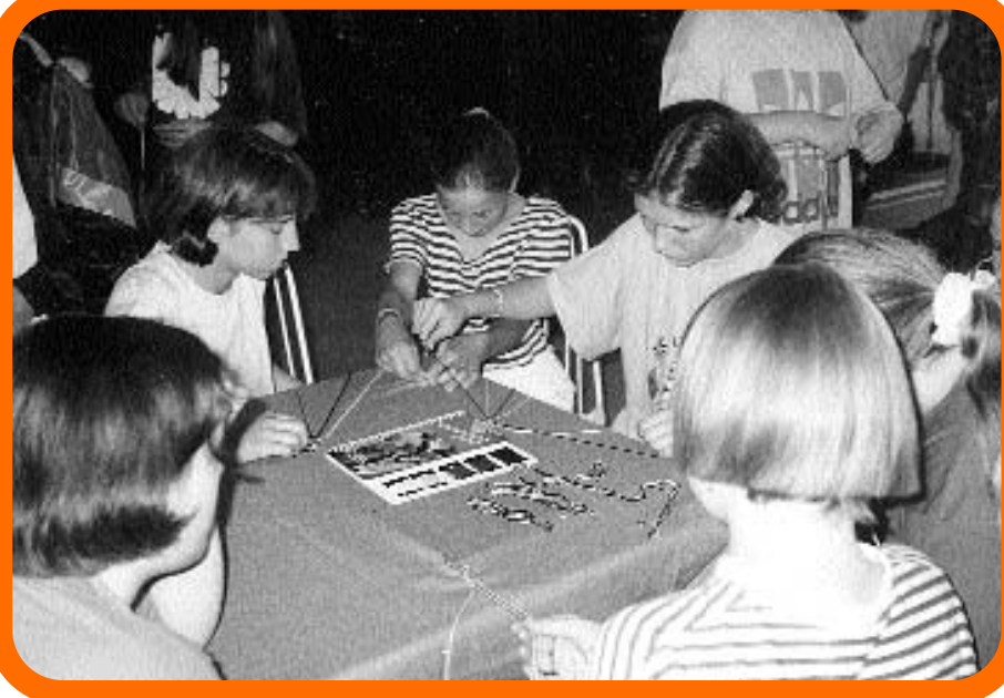
Izrada narukvica prijateljstva, kreativna radionica u sklopu ljetovanja u Živogošću.

Ono što se može istaći kao jedno od najvažnijih obilježja ovoga Programa je njegova sveobuhvatnost koja podrazumije-