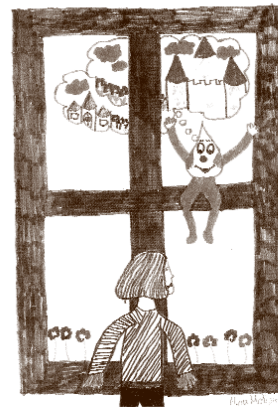
Dječji rad nastao kao rezultat art-terapije

U škole i na fakultete, međutim, obrazovanje za mir, demokraciju i ljudska prava ulazi polako (do sada uglavnom na "mala vrata"), a potrebe su velike i držim da zahtijevaju sustavni odgovor kroz redovni obrazovni sistem. Ako ništa drugo, u prilog tome govori stanje u osnovnim školama u Podunavlju. Poštujući manjinska prava za obrazovanjem na materinjem srpskom jeziku, formirani su odvojeni razredi učenika, a bez ikakvog sustavnog prostora za međusobnom komunikacijom i razmjenom. Djeca su vrlo brzo shvatila poruku i počela usvajati segregacijsko ponašanje - u nekim školama odbijaju koristiti iste toalete. Ili, zar na porast nasilja u školama odgovoriti tek dežurnim telefonom ili pojačanim policijskom nadzorom? Doista postoje i drugi odgovori koji ne bi smjeli, u obrazovanju, ostati marginalizirana alternativa. □