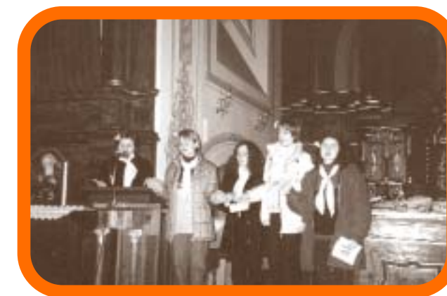
Zajednička molitva u Kapucinskoj crkvi.

Centra za mir već četvrtu godinu u Osijeku organizira Svjetski dan molitve, koji je ove godine bio održan u Kapucinskom samostanu. Molitva je imala moto: " Učimo jedni od drugih,