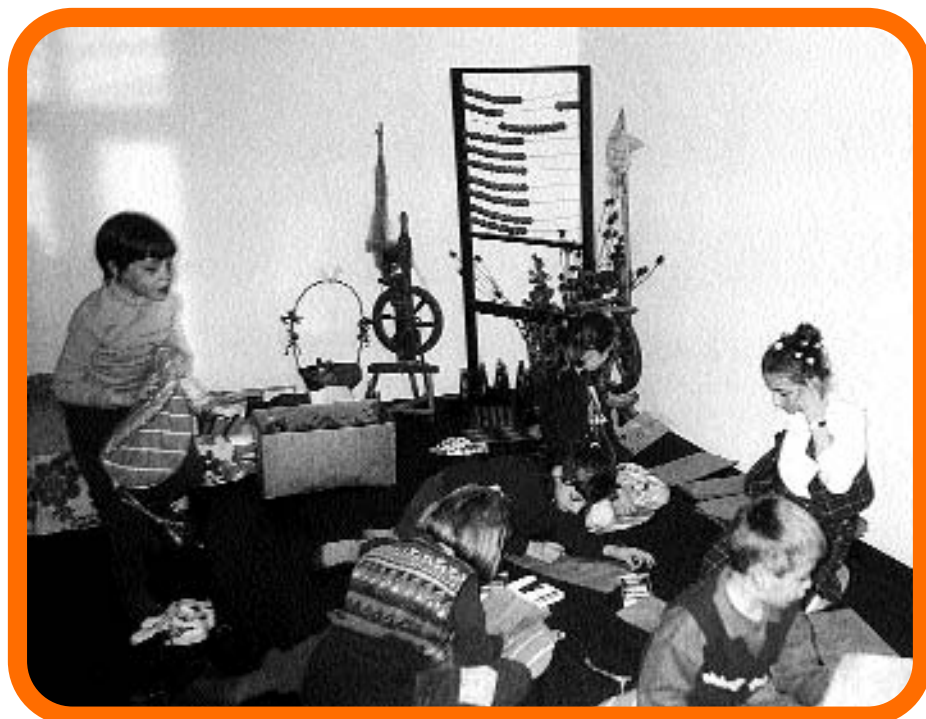
Djeca pripremaju izložbu nakon radionice: proljeće na vrećicama.

kolačiće od integralnog brašna i oslikavala papirnate vrećice. Te su proizvode volonteri Centra za mir prodavali na štandu postavljenom u središtu Osijeka 31. ožujka s ciljem prikupljanja sredstava za pokretanje akcije popravka krovništva crkvice u Latinovcu. Aktivisti Zelenog Osijeka dijelili su promotivne materijale o eko-hrani, a na štandu su svoje mjesto našli i proizvođači organski uzgojene hrane iz Slavonije i Baranje, te udruga BIOPA, čiji su članovi nudili građanima degustaciju i prodaju svojih proizvoda. Od 8 do 13 sati prodani su i podijeljeni svi ponuđeni proizvodi.