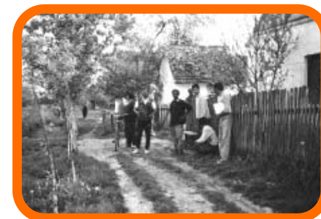
Članovi romske zajednice.

Od 285 intervjuiranih osoba 247 je ostalnika i 32 povratnika iz SRJ, Njemačke, Austrije, Mađarske, te 1 doseljenik iz Osijeka. U 285 obitelji živi 140 djece u dobi do 6 godina, 238 od 6 do 18 godina i 53 mladih koji su stariji od 18 godina.