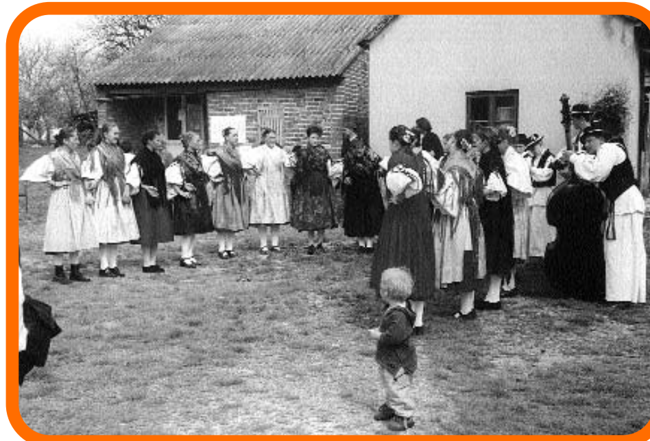
Detalj sa završne radionice ciklusa "Korak zajedno u volonterski rad" održane u Latinovcu - nastup KUD-a "Orjava" iz Pleternice.

putem iskustvenog učenja, praktičnih primjera i vježbi relaksacije primili osnovna znanja i vještine iz područja nenasilne i neverbalne komunikacije, ophođenja sa stresom, uloge građana u demokratskom društvu, zagovaranja i javnog djelovanja. Koristeći radionički način izobrazbe, sudionicima je pružena mogućnost rada na sebi, ali i iskustvo timskog rada pri realizaciji budućih aktivnosti. Polazeći od pretpostavke kako već postoje strukturirane organizacije koje trebaju volontere,